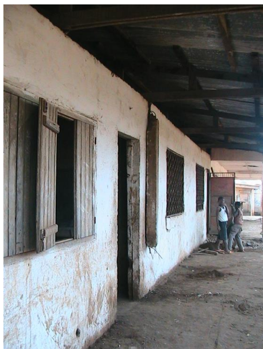
Façade : AVANT