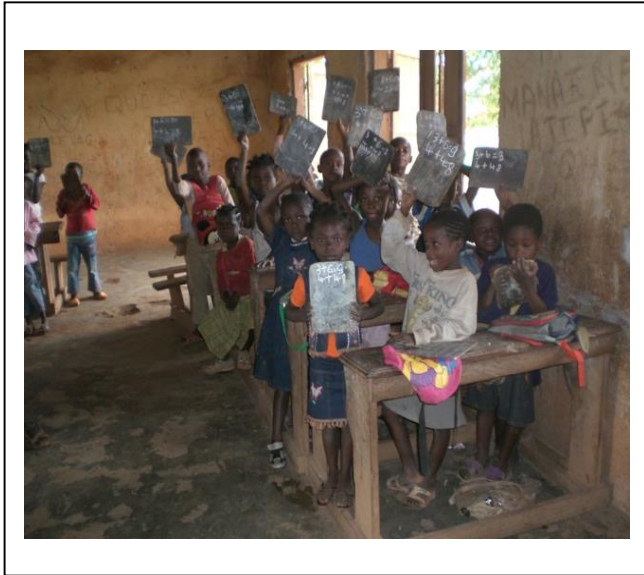
Vue Intérieure Avant