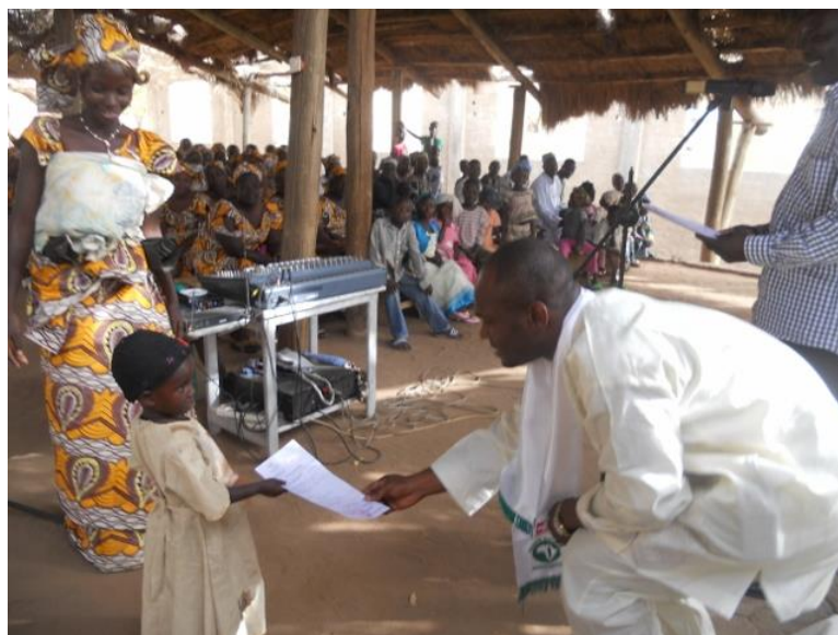
Remise des actes de naissance